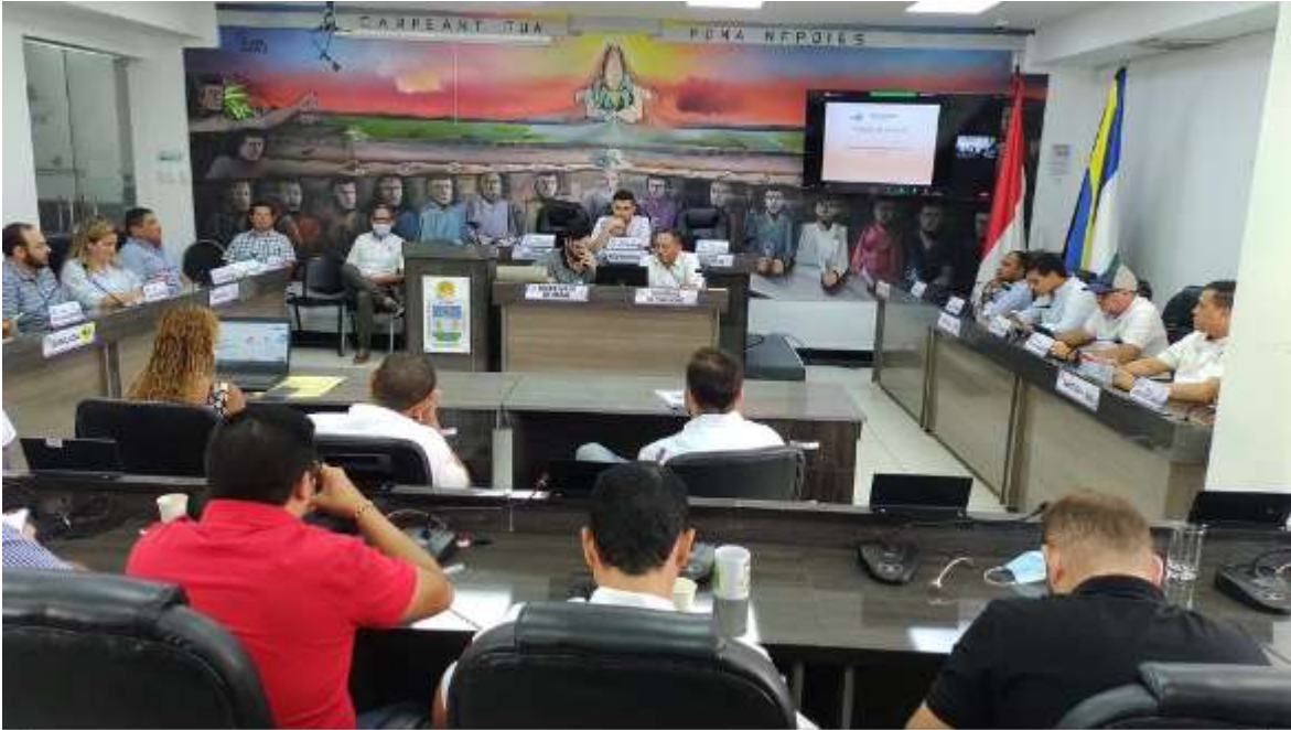
Debate de control político a la Secretaría de tránsito.